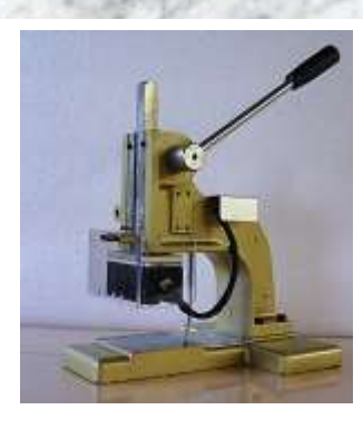
ALTRI COLORI DISPONIBILI OTHER COLOURS AVAILABLE

I dati tecnici hanno carattere informativo e non impegnativo per la società SICOME SRL la quale si riserva di apportare qualsiasi tipo di variazione al prodotto. The technical features are informative and not binding SICOME SRL company that may modify the product under its judgement.