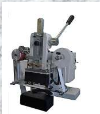
EM1 PER STAMPA CALTAGNO EM1 FOR PRINTING THE HEEL

ALTRE VERSIONI – OTHER VERSIONS – AUTRES VERSIONS –